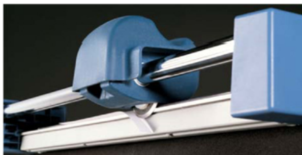
LAMA ROTANTE IN ACCIAIO TEMPRATO AL CARBONIO Per tagli facili e precisi di alti spessori di carta con il vantaggio di tagliare in entrambe le direzioni